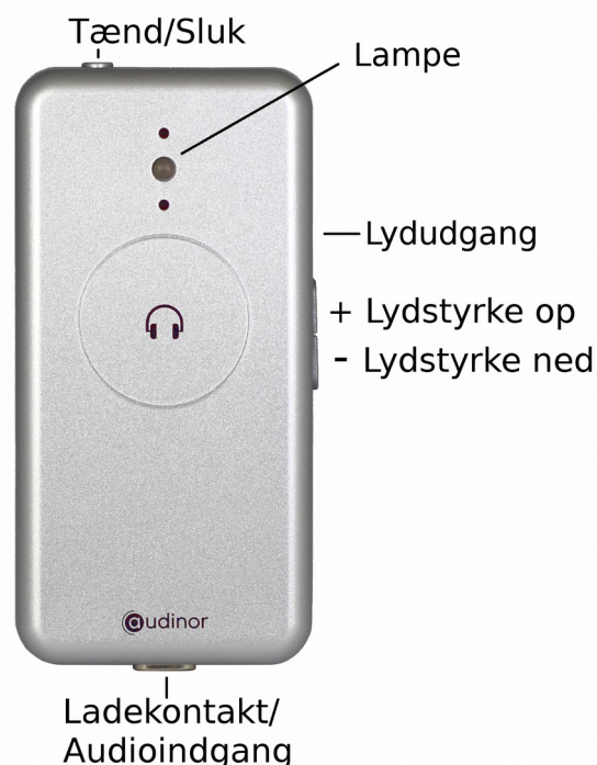
Modtager til dig