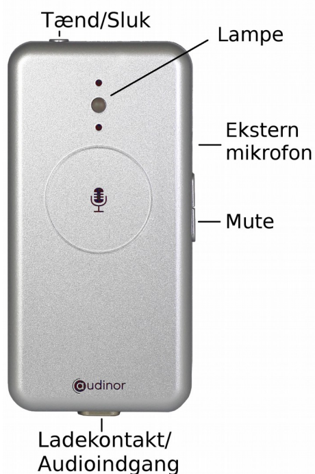
Mikrofon til samtalepartner